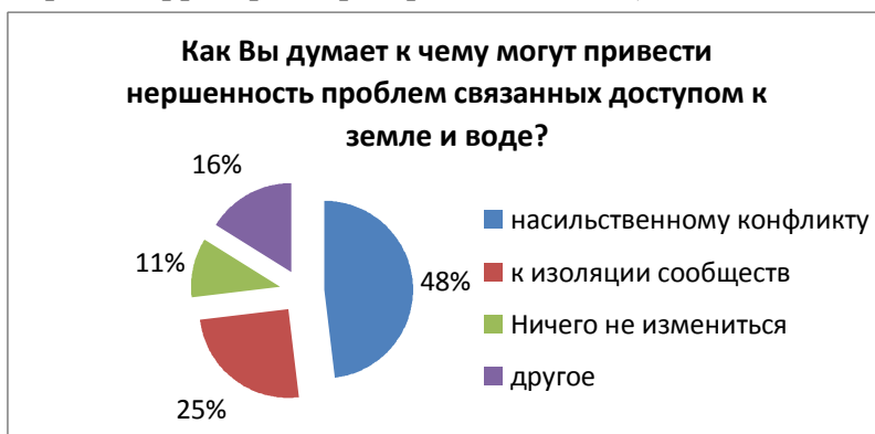
Диаграмма 2. Опрос проведен на приграничных сообществах КР и РТ, в рамках исследования проведенного ОФ «Мирное развитие в Ферганской Долине» (КР) и ОФ «Иттифок» (РТ), на тему Доступ к ресурсам: наличие спорных территорий и распределение воды)

Таким образом, вероятность того, что приграничные миграции вперемешку с конфликтами из-за ресурсов могут перерасти в конфликты на этнической плоскости высокая,