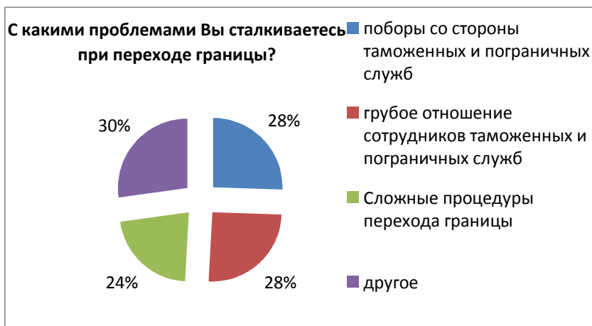
Диаграмма 5. Основные проблемы при переходе границы 76

Таким образом, учитывая все вышеизложенное можно говорить о необходимости принятия срочных мер для улучшения социально-экономической ситуации в регионе. Комплекс мер должен включать в себя меры, направленные на развитие аграрного сектора экономики, привлечение иностранных инвестиций, формирование системы экспорта рабочей силы и самое главное, кооперации всех стран региона в решении перечисленных проблем.