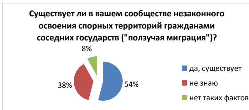
Диаграмма 1. Опрос проведен в приграничных сообществах Лейлекского и Баткенского районов [142, с.18]

Особенно эти процессы ярко выражены в следующих муниципалитетах: Жаныжер (села Борбордук и Арка) и Кулунду